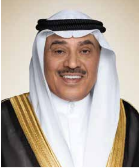
سمو الشيخ صباح الخالد الصباح ولي عهد دولة الكويت