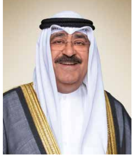
حضرة صاحب سمو الشيخ مشعل الأحمد الجابر الصباح أمير دولة الكويت